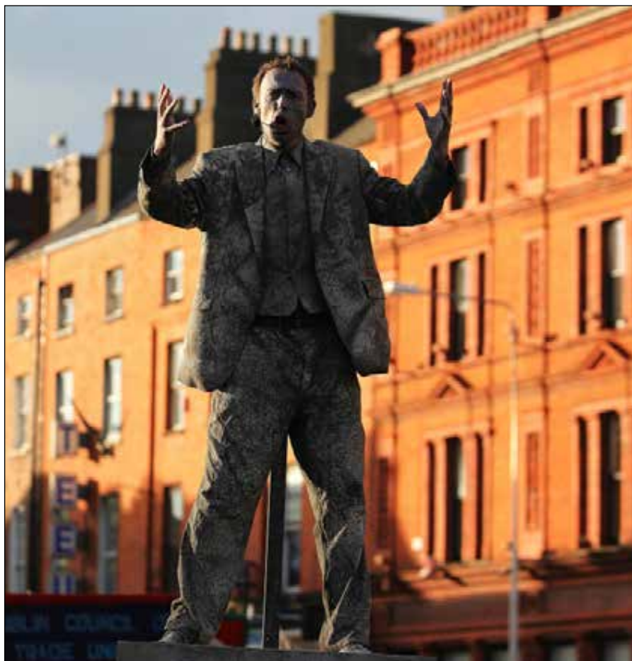
Джим Ларкин стал в буквальном смысле идиолом ирландских активистов. На фото — участник первомайской демонстрации в Дублине изображает памятник Ларкину, который стоит у здания парламента страны на О'Коннелл-стрит — главной улице ирландской столицы.

Коннолли был настоящим «человеком, который сделал себя сам». Он родился в ирландской рабочей семье в Эдинбурге и, как вспоминали современники, от характерного шотландского акцента не избавился до самой смерти. Несколько классов школы, труд с детства, бегство в армию от бедности и дезертирство из нее из-за любви (полк Коннолли собирались перебросить в Индию, разлучив его с невестой). Затем — знакомство с марксизмом, жизнь и социалистическая деятельность в Америке, издание собственной газеты и ряда книг и памфлетов. В общем, хватило, чтобы заработать уважение среди рабочих!