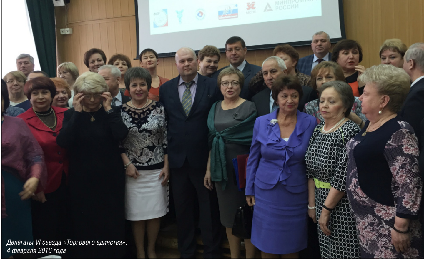
Делегаты VI съезда «Торгового единства», 4 февраля 2016 года

раздевалке могут подбросить товар со склада. И доказать, что его подбросили, очень трудно. Доходила до нас и информация о конфликтах, переросших буквально в драку между подчиненным и его начальником, но это, слава богу, к членам профсоюза отношения не имело.