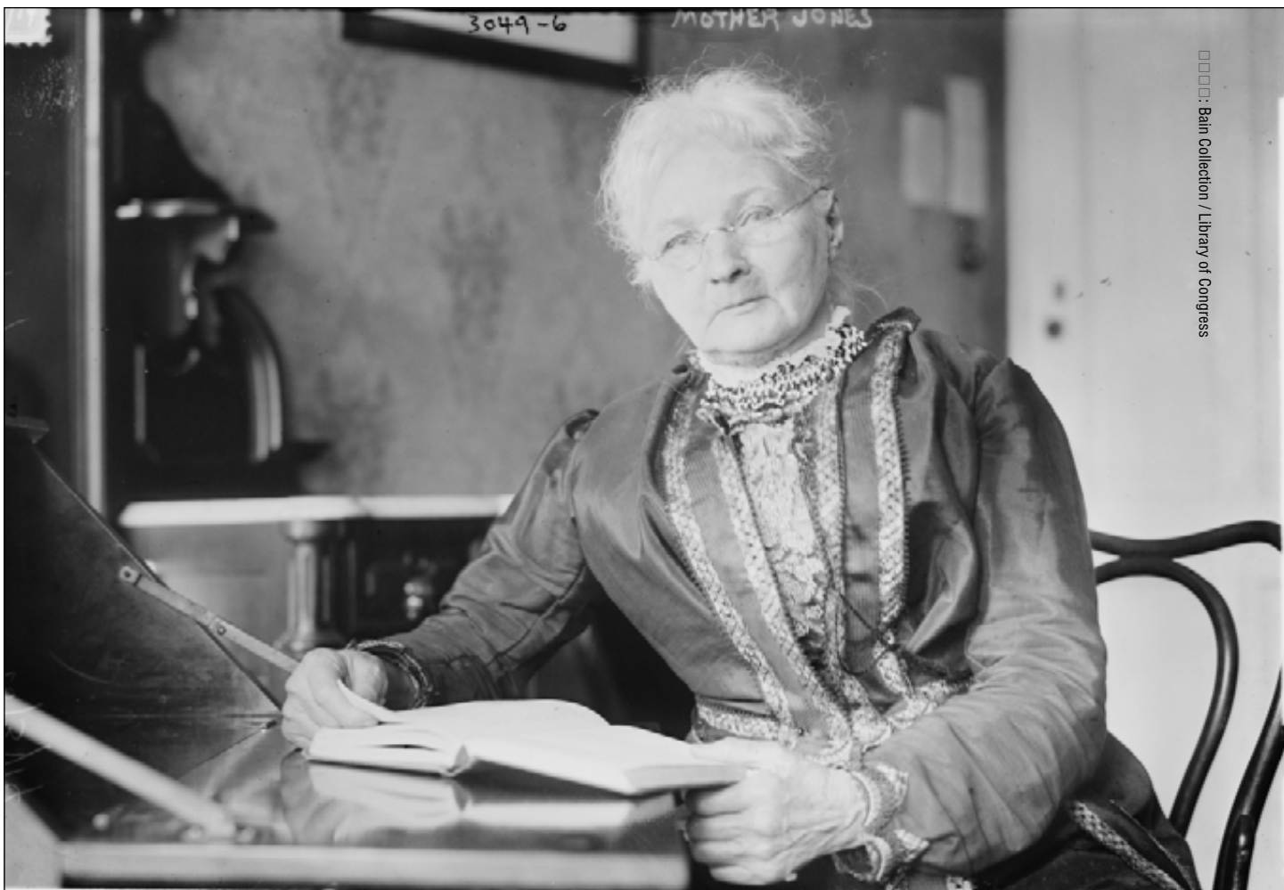
Старушка в элегантных старомодных платьях, Мамаша Джонс, однако, одним словом могла повести на забастовку воинственную многотысячную толпу рабочих. Неудивительно, что с «самой опасной женщиной США» приходилось считаться и сильным мира сего. На фото слева — Мэри Джонс и 30-й президент США Калвин Кулидж (1924 г.).