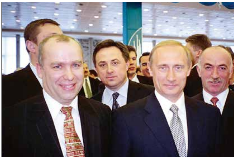
На фото внизу — на инаугурации президента Владимира Путина, май 2000 года.

борах. Путин в ответ пригласил меня в Кремль. Поговорили немного о ситуации в городе, в профсоюзном движении. В мае президент создал федеральные округа. И мне, как человеку,