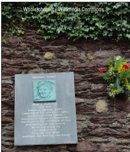
Память американской ирландки Мэри Харрис Джонс и сегодня чтят на обеих ее родинах. Слева — мемориальная доска на месте ее рождения в Корке, Ирландия.