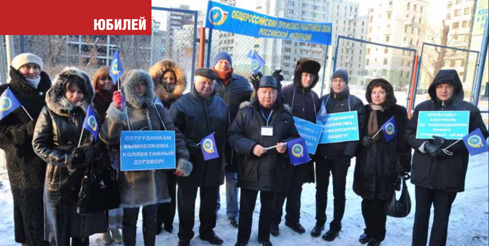
Пикетирование центрального офиса ОАО «ВымпелКом» (торговая марка «Билайн») 15 декабря 2009 года в Москве.