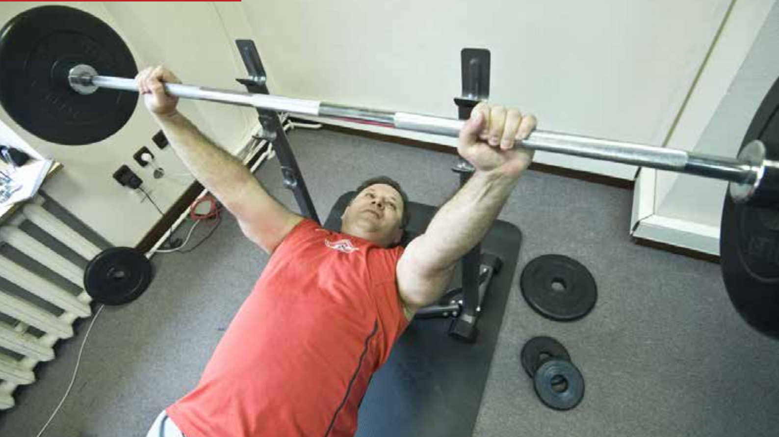
В кабинете главного редактора «Солидарности» стоит скамья для жима лежа. И вот как она используется. На фото справа — на Первомайской демонстрации, 2016 год.

понятное стратегическое направление. Любимая фраза бюрократов — «дорожная карта». Вот она должна быть у профсоюзов.