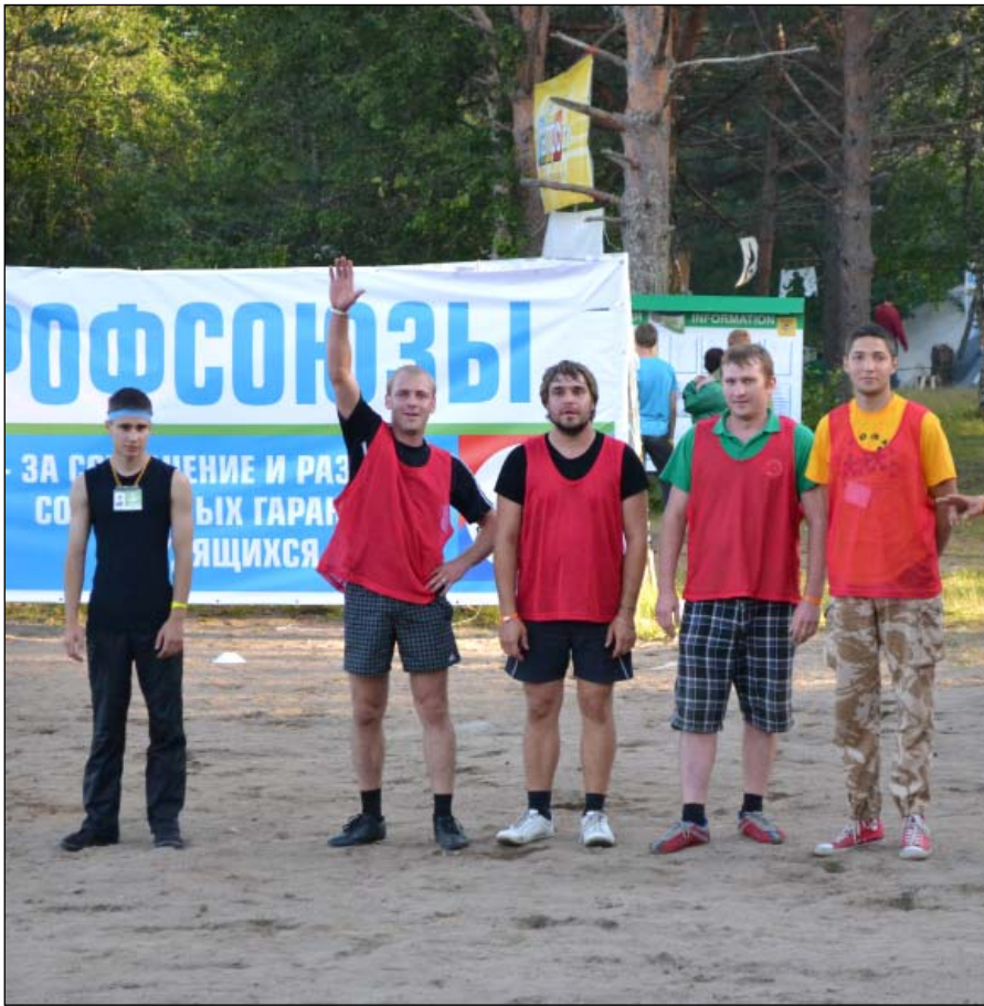
Профактив Общероссийского профсоюза авиационных работников на молодежном форуме ФНПР в Карелии.