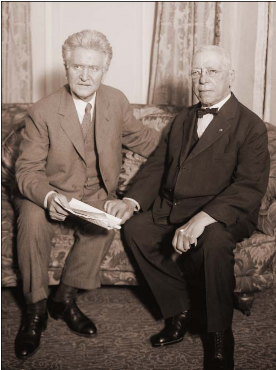
Сэмюэл Гомперс (справа) с Робертом Лафолеттом-старшим – сенатором от штата Висконсин и кандидатом в президенты США от Прогрессивной партии. Деятельность этой партии, призывавшей к социальным реформам, поддерживалась Американской федерацией труда. Фотография сделана в сентябре 1924 года, за несколько месяцев до смерти Гомперса.

ли в Ист-Сайде напротив скотобойни. Первое время Самуил Гомперц (впрочем, будем теперь называть его Сэмюэлом Гомперсом : уже в юности он отдался от прадедовской религии и почти перестал говорить на идише) помогает отцу, но затем отправляется зарабатывать деньги самостоятельно.