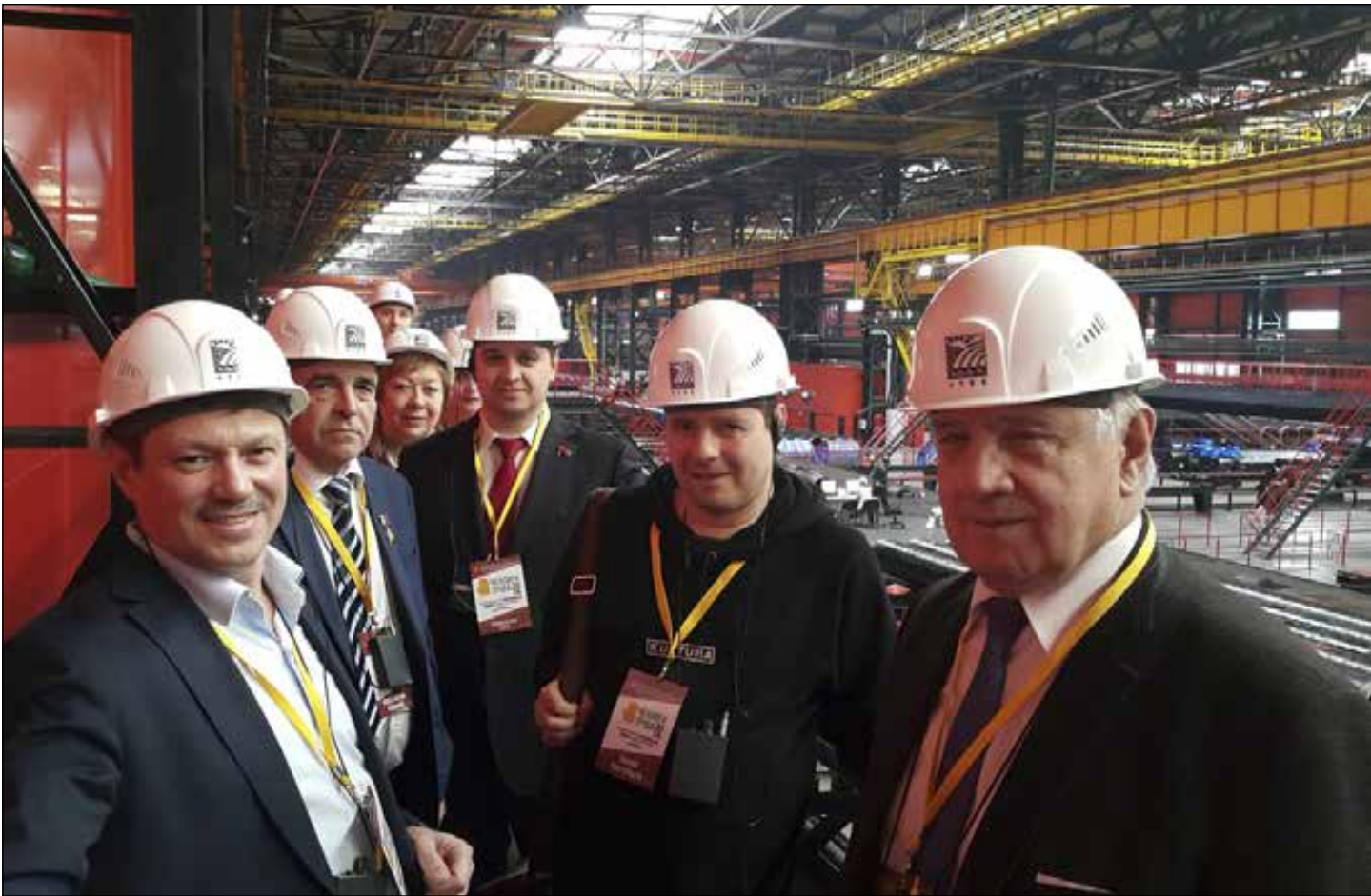
На Втором российском кинофестивале «Человек труда» в цехе Челябинского трубопрокатного завода, 2016 год.