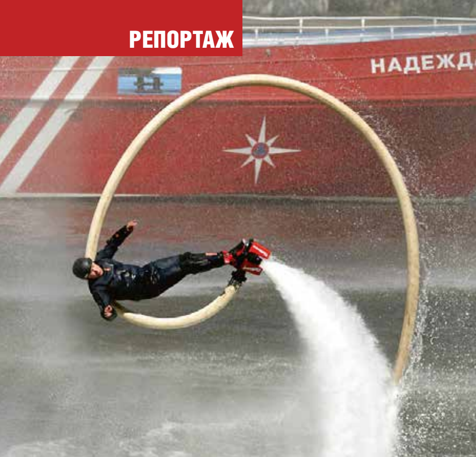
Сотрудник ГУ МЧС России по городу Москве на флайборде во время показательных пожарно-тактических учений на торгово-пешеходном мосту «Багратион». На фото справа — спасательный вертолет Ка-32А на учениях.