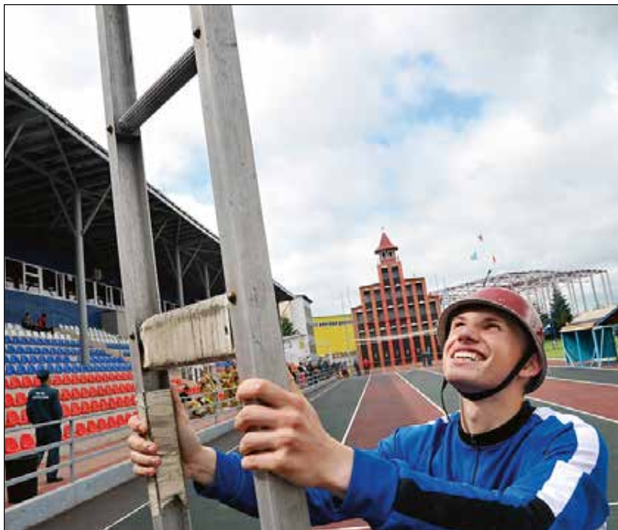
Пожарные и спасатели проходят постоянные тренировки, которые включены в их рабочий график. Поэтому занятия спортом вне рабочего времени как элемент тимбилдинга были бы, пожалуй, уже излишними. Тем более что коллектив ПСЦ и так сплочен, что дальше, кажется, и некуда.

по-настоящему, что ли, поехали?» Да, как оказалось, это был настоящий вызов.