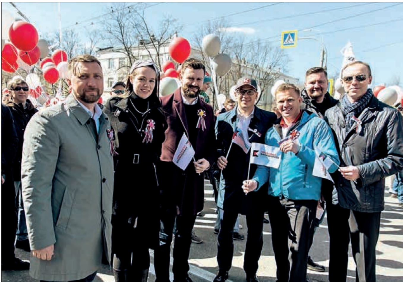
Профактив профсоюзной организации Концерна «Калашников» на Первомайской акции в Ижевске.