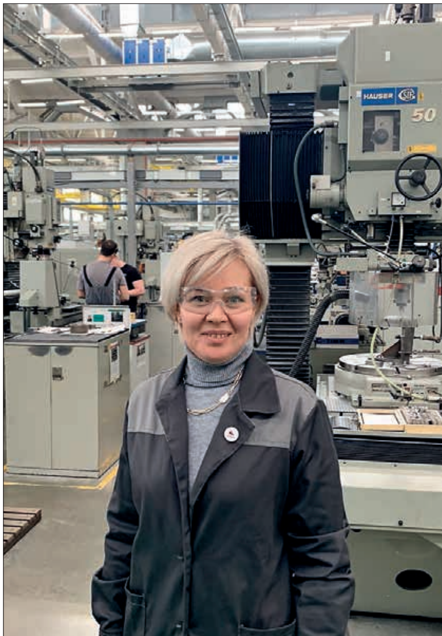
Профсоюзное комьюнити в соцсети «ВКонтакте» стало фундаментом для эффективной информационной работы первички. На фото справа: «Этот человек отвечает за твою безопасность» — напоминание для работников: надо соблюдать правила охраны труда!

правовые договоры, — рассказывает Юлия. — Вопросы, связанные непосредственно с работой, тоже встречаются. Но их, честно говоря, значительно меньше. В этих случаях налажена такая схема работы: работник пишет заявление на предоставление профсоюзной помощи, мы запрашиваем документы у представителя администрации, анализируем их и в случае допущенных работодателем нарушений выносим предписание по их устранению.