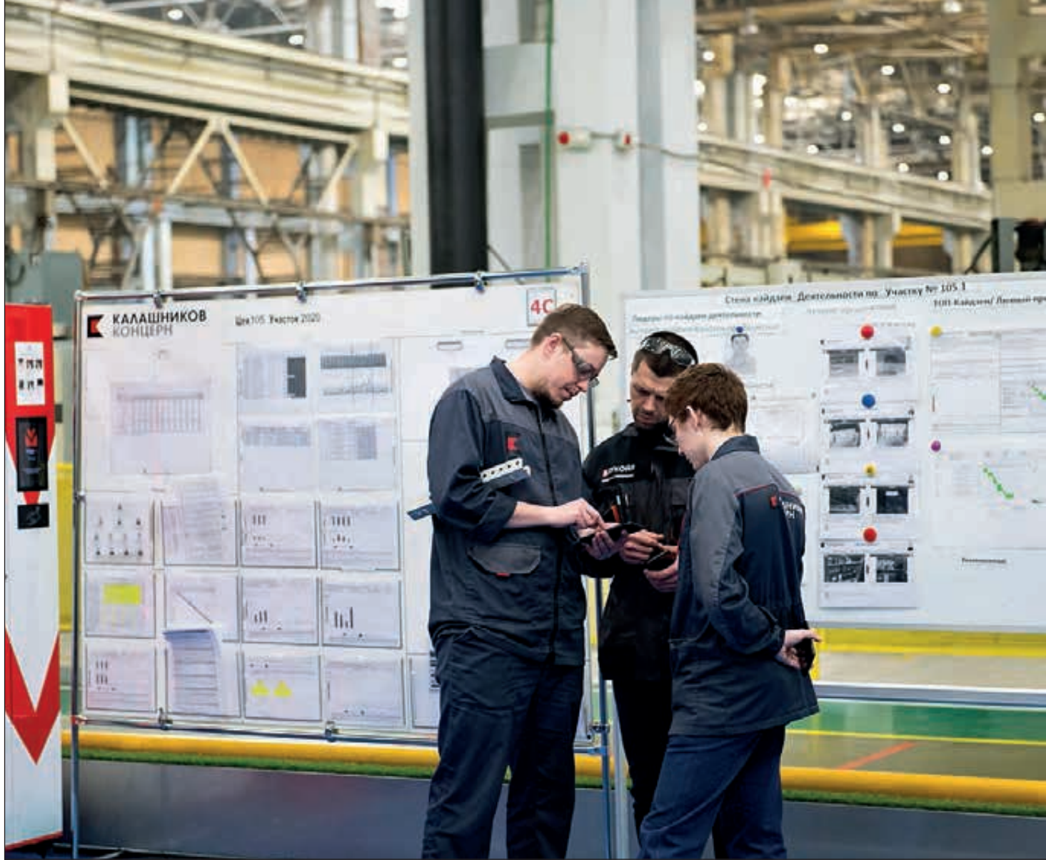
Организация работы по принципу производственной системы — одна из главных управленческих новаций в концерне.

прохода на предприятие, работающее с гособоронзаказом, при должном оформлении документов на все проверки уходят считанные минуты. Ни лишней бюрократии, ни задумчивых «бабушек-вахтеров». Сразу видно: здесь умеют ценить свое и чужое время. Люди, по долгу службы часто бывающие на промышленных производствах, знают: если театр начинается с вешалки, то завод — как раз с проходной. И уже по ней можно судить, чем встретят территории предприятия и цеха.