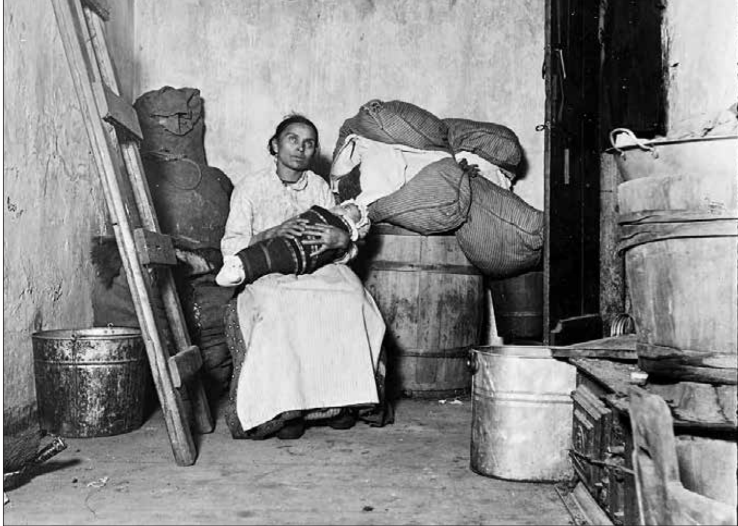
Фотография итальянки — сборщицы ветоши — с ребенком должна была сразу напомнить всем зрителям хорошо знакомый сюжет — Мария с младенцем Иисусом. Слева: семья из семи человек, которая ютится в небольшой комнатке, — еще не так уж и плохо для Малберри-стрит.