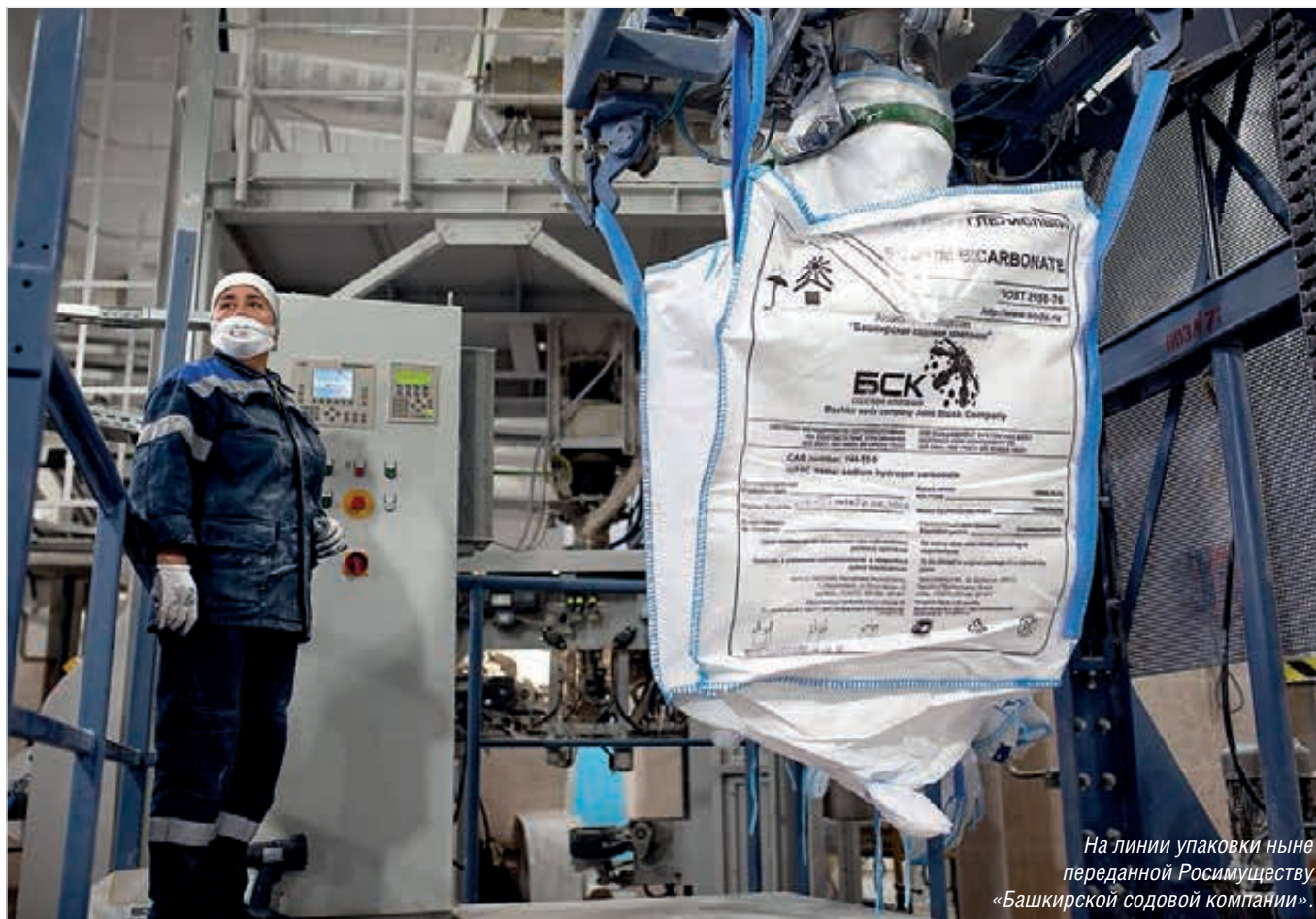
На линии упаковки ныне переданной Росимуществу «Башкирской содовой компании».

полностью удовлетворил иск Генпрокуратуры РФ об изъятии акций Башкирской содовой компании в пользу Федерального агентства по управлению государственным имуществом (Росимущество).