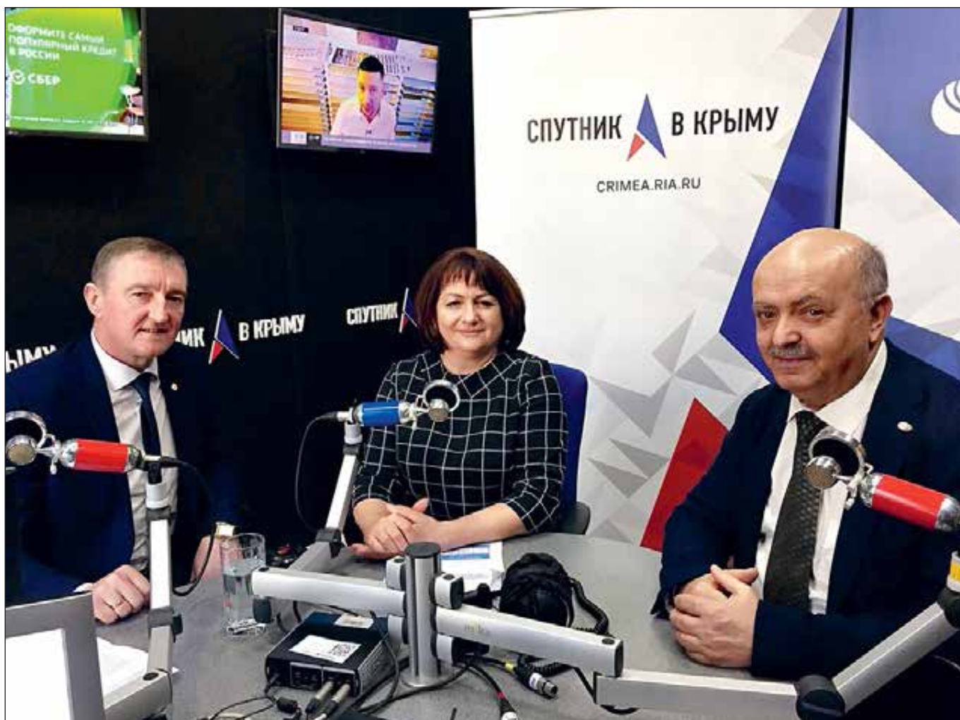
В ФНПК особое внимание уделяют информационной работе: одних только теле- и радиоэфиров за прошлый год набралось около пятидесяти — далеко не каждое профобъединение может похвастать подобным. Справа: молодежь профсоюзов Крыма хорошо заметна и на федеральном уровне, будучи частью стратегического резерва ФНПР.

микрорайонами. Наверное, не так все быстро, как хотелось бы, но и на то есть объективные причины.