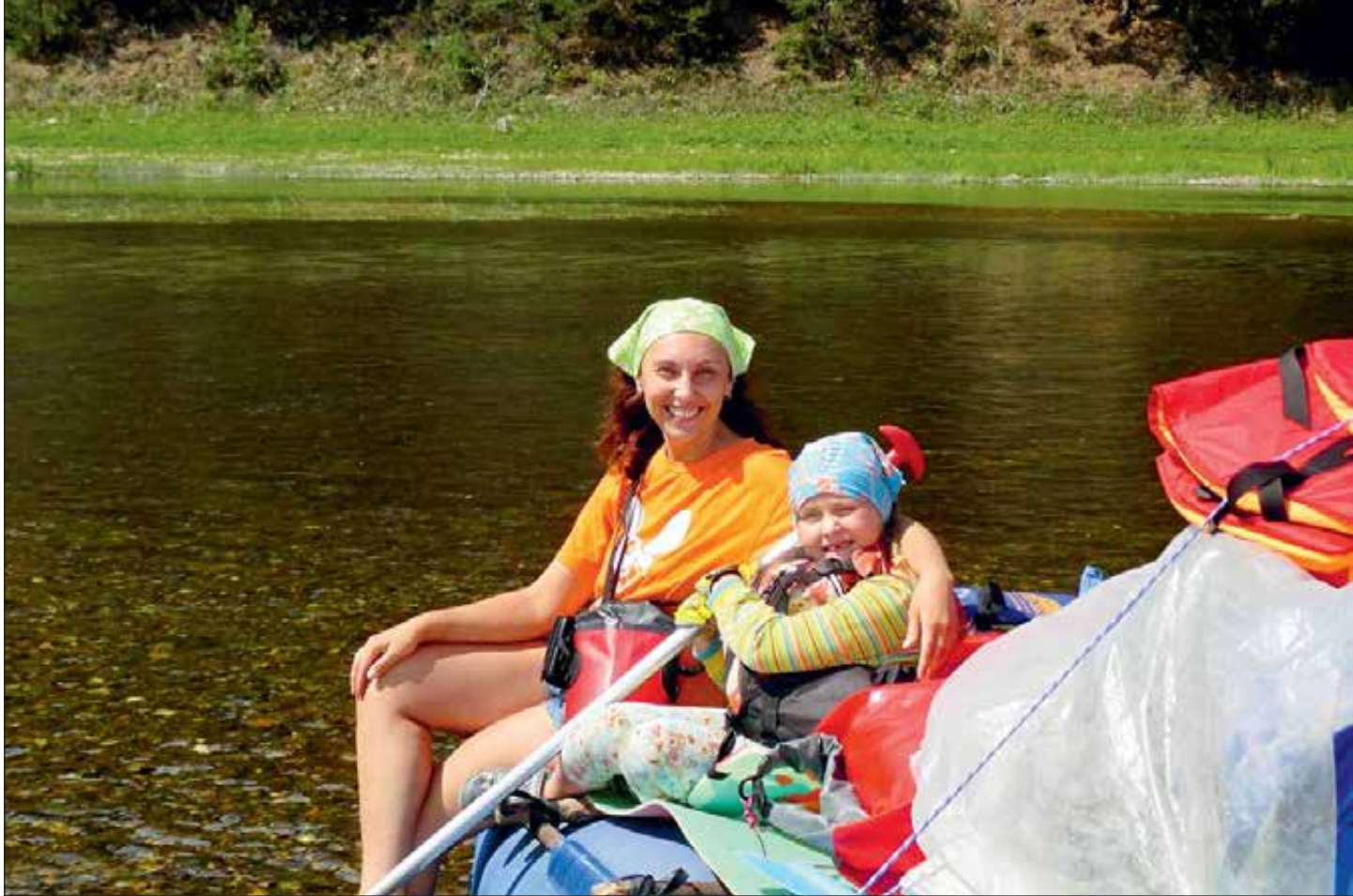
Сплав по уральской реке Белая — лучший вариант семейного отдыха! Слева: лучше гор могут быть только другие горы! Подъемник на горе Чегет (Кабардино-Балкария).

— Художественную школу, наконец, окончили?