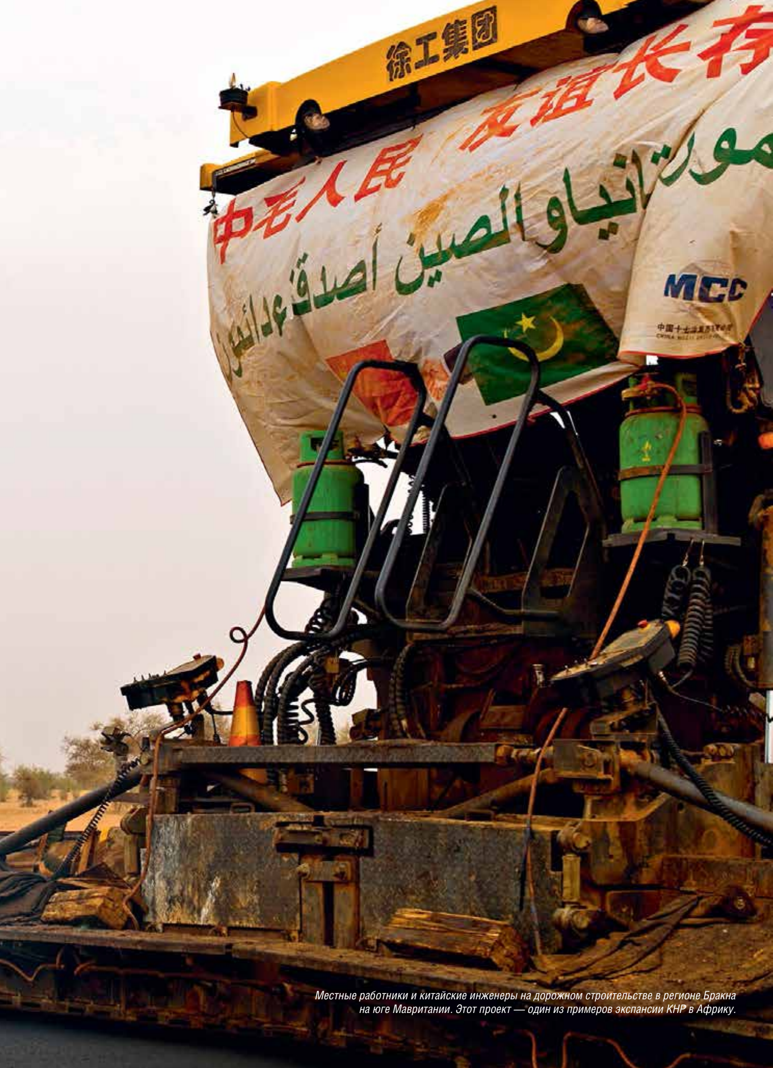
Местные работники и китайские инженеры на дорожном строительстве в регионе Бракна на юге Мавритании. Этот проект — один из примеров экспансии КНР в Африку.