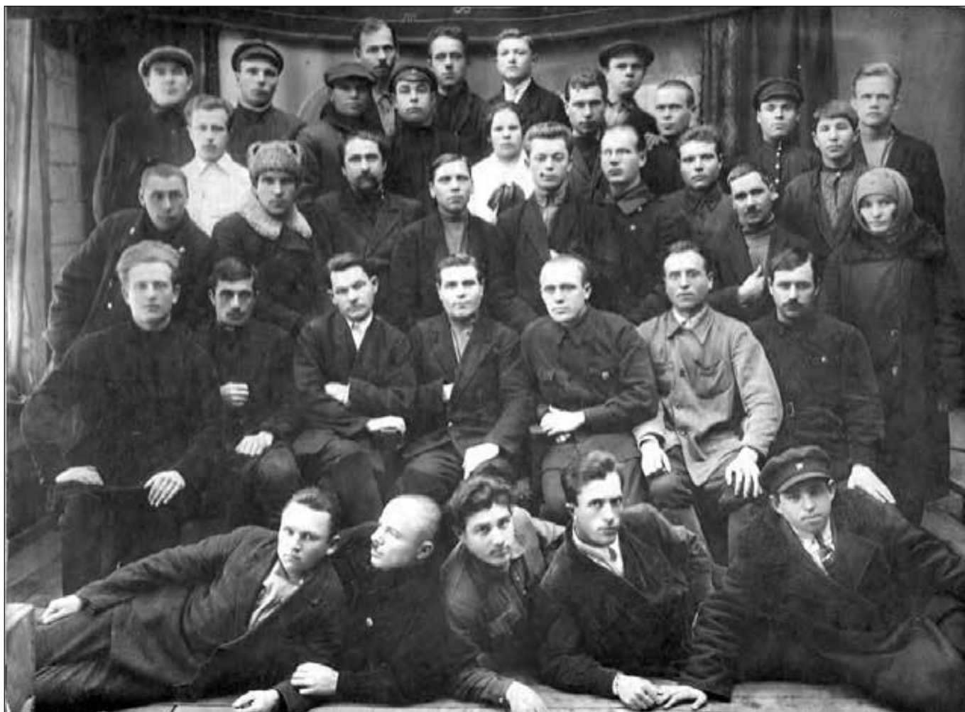
Партактив завода, 1925–1927 гг.