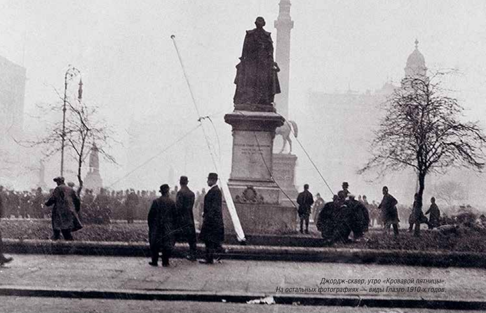
Джордж-сквер, утро «Кровавой пятницы». На остальных фотографиях — виды Глазго 1910-х годов.