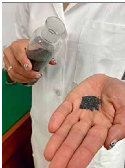
Производство пороха — процесс долгий, трудоемкий и требующий множества различных реагентов. Подробно узнать о том, как делается порох, можно в цехах завода и в лаборатории.