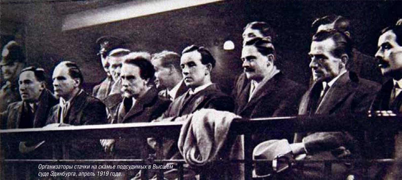
Организаторы стачки на скамье подсудимых в Высшем суде Эдинбурга, апрель 1919 года.