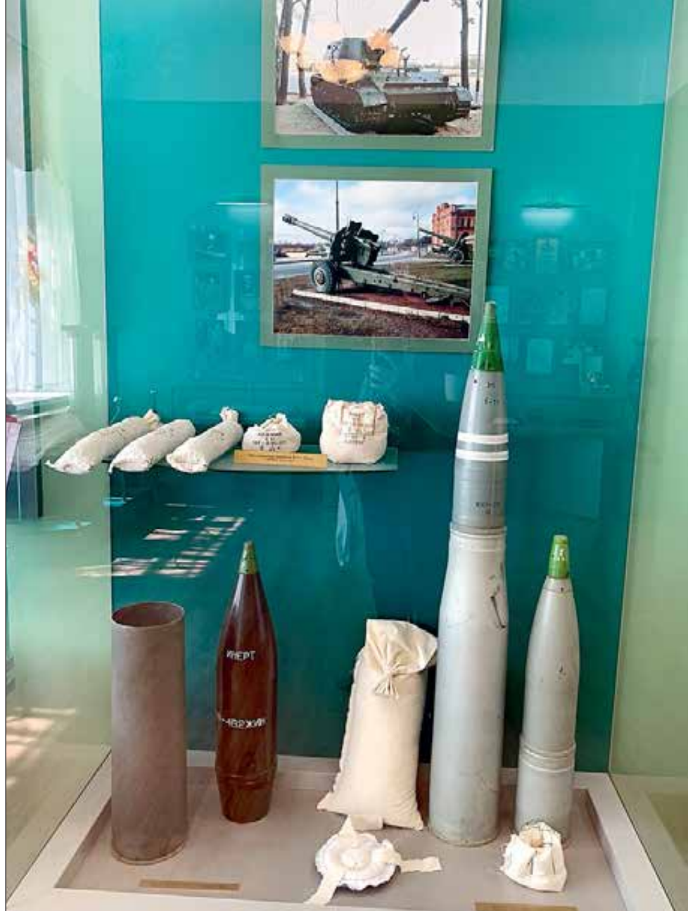
Экспонаты заводского музея в полной мере свидетельствуют о богатой и многогранной истории предприятия, тесно переплетенной с историей нашей страны.

своими энергетическими свойствами. Важно то, что при обработке нитроцеллюлозы дополнительными реагентами получаются разные марки порохов, подходящие под нужды тех или иных орудий. На заводе изготавливаются заряды для морского, артиллерийского, танкового вооружения, систем ближнего боя, а также порох для спортивных и охотничьих патронов. То есть фактически все возможные боеприпасы.