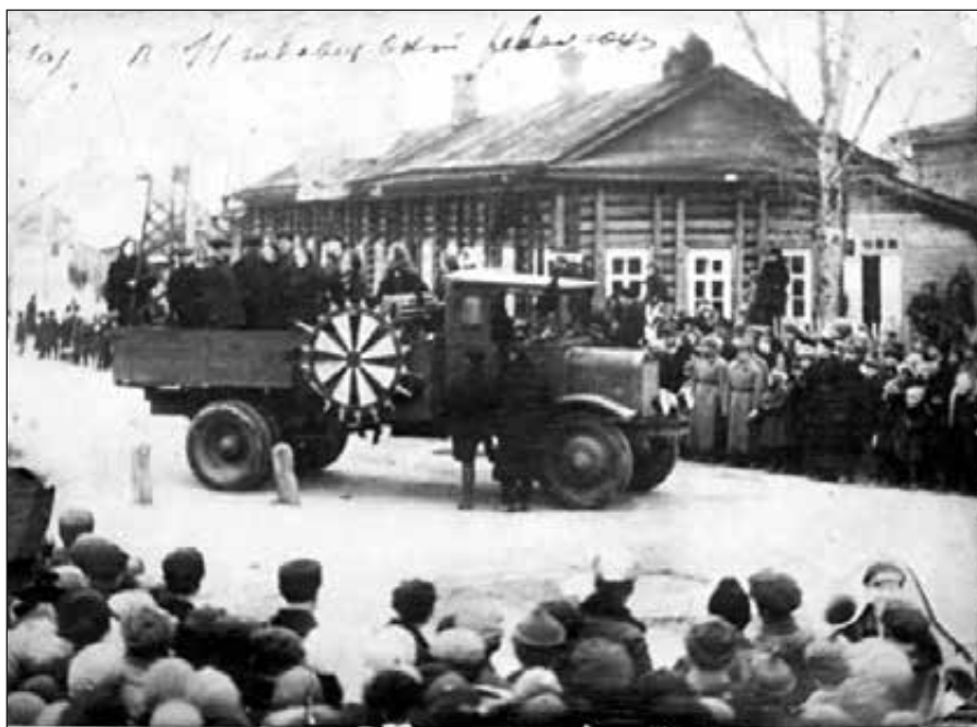
Оформление демонстрации района в честь 11 годовщины Октября. — 1928 г.

их вариации с высокой степенью защиты от внешних воздействий. Такие емкости ни в воде не мокнут, ни в огне не горят. То есть заказчик получит продукт в целостности и сохранности.